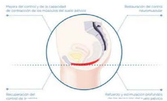
Suelo pélvico estimulado

EMS SCULPTOR permite el tratamiento de los músculos y de los principales componentes del tejido conjuntivo en el área del suelo pélvico