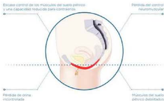
Suelo pélvico relajado y debilitado

El envejecimiento, los partos y la menopausia pueden causar la incontinencia y la reducción de la satisfacción íntima